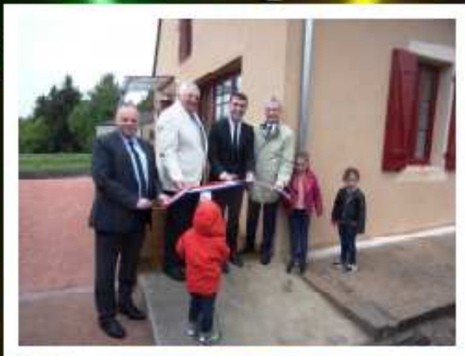
Maison d'Assistante Maternelles